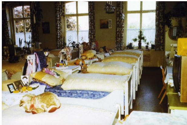
Anfang der 1980er Jahre