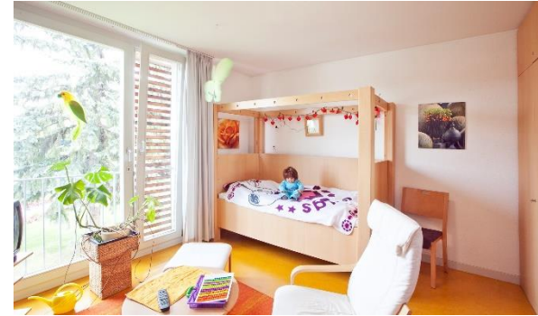
Anfang der 2010er Jahre